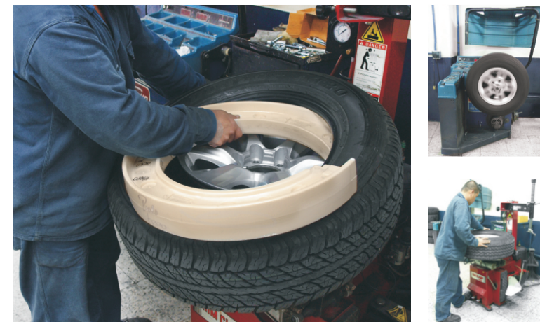
Otros sistemas Other systems

Its wheel fitting mechanism has proven maximum reliability in adverse situations. It also allows you to disassemble the runflat in case of changing the wheels or repairing them by damages.